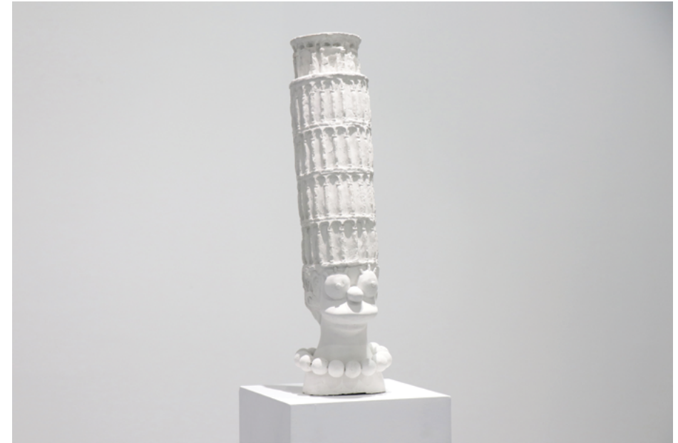
XIV VANJA MIJATOVIĆ (Beograd, 1997) Mardž , gips, 65×18×23 cm, 2020.

Strukturalni integritet sećanja, posebno kada je ono vezano za objekte, je nepouzdan. Asocijacije koje održavaju određene tačke u memoriji su uvek podložne promenama koje ne možemo izbeći, koliko god se trudili da ih očuvamo. Subjekat se projektuje na objekat, oni međusobno utiču jedan na drugog i tako uvezani u čvorove grade koliko simbiotičan, toliko i parazitski odnos. Rad se fokusira na posmatranje procesa propadanja, i postepenog prihvatanja činjenice da taj tok dešavanja malo šta može da spreči ili preusmeri. Kada objekat izgubi funkciju, zadržava sentimentalni značaj. Kada je već lišen funkcije, a izgubi i formu, biva pounutren kao simbol. Tek tada, nakon potpune transformacije, možemo se usuditi da od njega očekujemo postojanost.