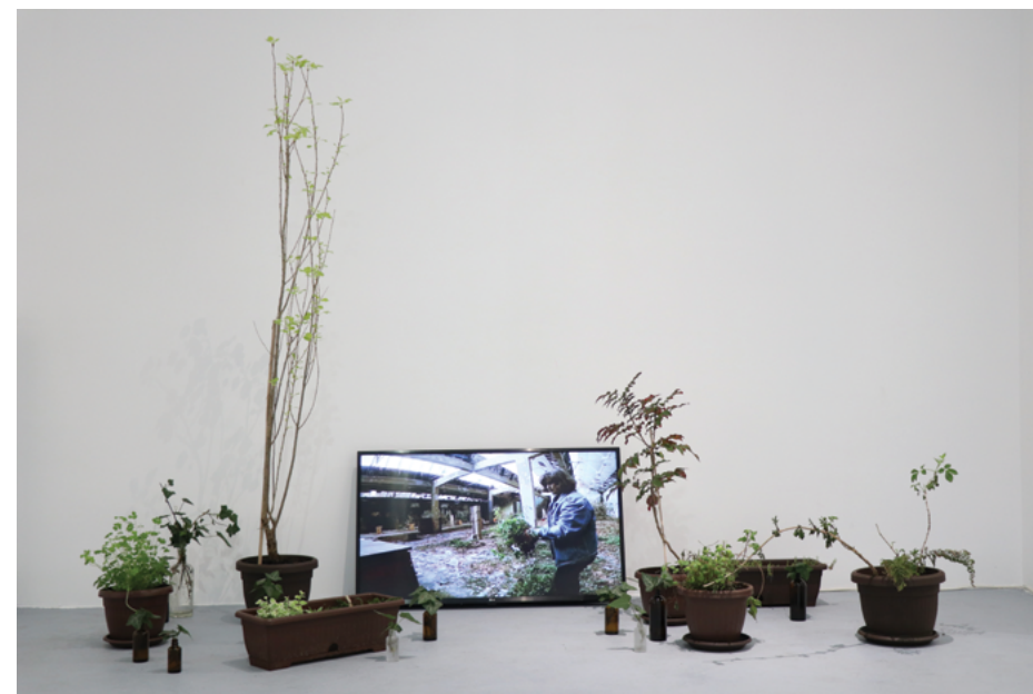
II MILICA BILANOVIĆ (Tuzla, BiH, 1997) Plants / plænts / industrijska postrojenja , intervencija u javnom prostoru, video dokumentacija, 7'14", i instalacija, 2021.

Napušteni prostori bivše industrije, nekadašnja društvena svojina, sada su potpuno odvojeni od javnosti, nedostupni i devastirani. Prostori kolektivnog upravljanja odavno su postali privatni prostori čiji vlasnici nikada nisu ni kročili u njih. Ovom akcijom preuzimam posljednje oblike života – invazivne biljke koje su obrasle po površinama prekrivajući tako ostatke industrijskih postrojenja. Samonikle biljke svojim korozivnim djelovanjem posljednji su preobražaj ovih heterotopija, one nagovještavaju zapostavljenost i prepuštenost vremenu tih prostora koji su lišeni svoje prvobitne funkcije. Vađenjem biljaka te njihovim razmnožavanjem i izlaganjem u galerijskom prostoru želim zainteresovati publiku za kolektivnu svijest i zajedničku brigu o njima.