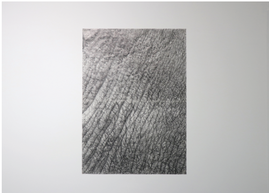
IX TEODORA NIKOLIĆ (Beograd, 1997)

Bez naziva , grafitna olovka na paus papiru, 140×100 cm, 2020.