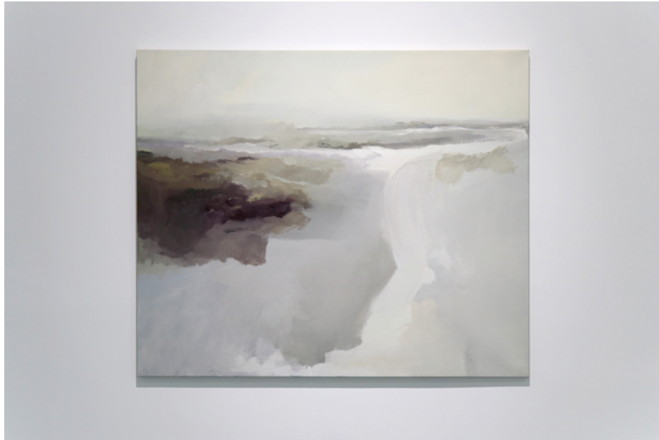
XI MARIJA JANIĆIJEVIĆ (Kragujevac, 1998) Pejzaž sećanja , ulje na platnu, 100×120 cm, 2020.

Sećanje je u ovom radu prva slika koja posreduje u nastajanju pejzaža. Kroz proces stvaranja pejzaža na osnovu sećanja, razvija se intimni odnos prema prostoru prirode. U tom smislu, iako priroda u sebi sadrži elemente koji čine univerzalni jezik putem kog pejzaž suptilno komunicira, on samo naizgled može biti shvaćen neutralno. Najličniji odnos koji se tokom rada na pejzažu razvija prema njegovom izvoru, a o kome svedoči način na koji je predstavljen, pokazuje da pejzaž zapravo nikada nije neutralan. Uz to, intrigantno je koliko jedan krajolik, za razliku od zemlje, nikada ne može biti nečiji posed, što dodatno pojačava osećaj pripadnosti.