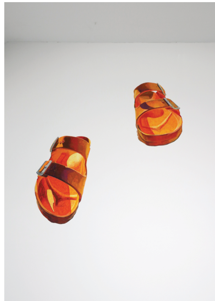
VIII UROŠ STOJILJKOVIĆ (Velika Plana, 1997) Papuče , prostorna instalacija, promenljive dimenzije, 2021.

U svom radu fokusirao sam se na temu šumskog pejzaža i istraživanje odnosa svetla i senke, koristeći kombinaciju različitih vrsta uglja na starom i prirodno požutelom papiru. S jedne strane, interesuju me pejzaži, prizori prirode, njihova univerzalna estetika i način na koji komuniciraju sa posmatračem. S druge strane, značajnim mi se činio proces prikaza šumskih pejzaža, namenski izvedenih prirodnim materijalima, ugljem na papiru, koji su derivati drveta, kao i misao da je uglj možda prvi crtački materijal koji je čovek koristio.