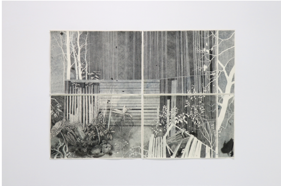
XIII ŽIVANA MIJAILOVIĆ (Sremska Mitrovica, 1997) Infestacija , akvarel i tuš na papiru, 70×100 cm, 2021.

Strukturalni integritet sećanja, posebno kada je ono vezano za objekte, je nepouzdan. Asocijacije koje održavaju određene tačke u memoriji su uvek podložne promenama koje ne možemo izbeći, koliko god se trudili da ih očuvamo. Subjekat se projektuje na objekat, oni međusobno utiču jedan na drugog i tako uvezani u čvorove grade koliko simbiotičan, toliko i parazitski odnos. Rad se fokusira na posmatranje procesa propadanja, i postepenog prihvatanja činjenice da taj tok dešavanja malo šta može da spreči ili preusmeri. Kada objekat izgubi funkciju, zadržava sentimentalni značaj. Kada je već lišen funkcije, a izgubi i formu, biva pounutren kao simbol. Tek tada, nakon potpune transformacije, možemo se usuditi da od njega očekujemo postojanost.