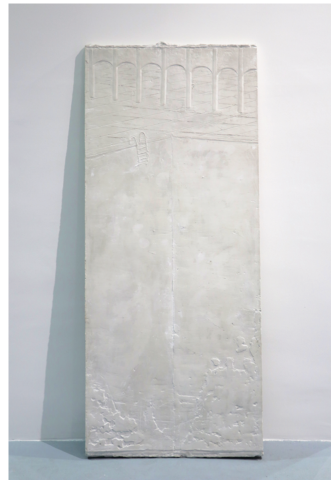
IV FILIP ĐUKIĆ (Beograd, 1996) Segment bazena , reljef od gipsa, 224×95 cm, 2020.

Koncept reljefa bazena povezujem sa ličnim iskustvom koji sam imao kroz sport, kroz razne uspone i padove. Sam prizor kao da nema ni početak ni kraj, zapravo kao da je samo isečak nečega što nam je već poznato. Bazen je kao arena koja zadržava moć prirode, odslikanu u količini vode koju pokušavamo da kontrolišemo. Na radu je bazen ispražnjen, što nije tako česta pojava, a sama praznoća ga čini drugačijim, pustim, neverovatno dubokim i nepristupačnim. Način na koji je prikazan neprirodan je za objekat koji sam izabrao i treba da stvori osećaj kao da se i sami nalazite u bazenu sa blagim osećajem neprijatnosti.