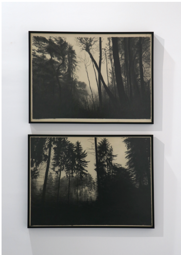
VII MILAN KACEVSKI (Beograd, 1982) Pejzaž , uglj na papiru, 65×85 cm, 2020. Pejzaž , uglj na papiru, 65×85 cm, 2020.

U svom radu fokusirao sam se na temu šumskog pejzaža i istraživanje odnosa svetla i senke, koristeći kombinaciju različitih vrsta uglja na starom i prirodno požutelom papiru. S jedne strane, interesuju me pejzaži, prizori prirode, njihova univerzalna estetika i način na koji komuniciraju sa posmatračem. S druge strane, značajnim mi se činio proces prikaza šumskih pejzaža, namenski izvedenih prirodnim materijalima, ugljem na papiru, koji su derivati drveta, kao i misao da je uglj možda prvi crtački materijal koji je čovek koristio.