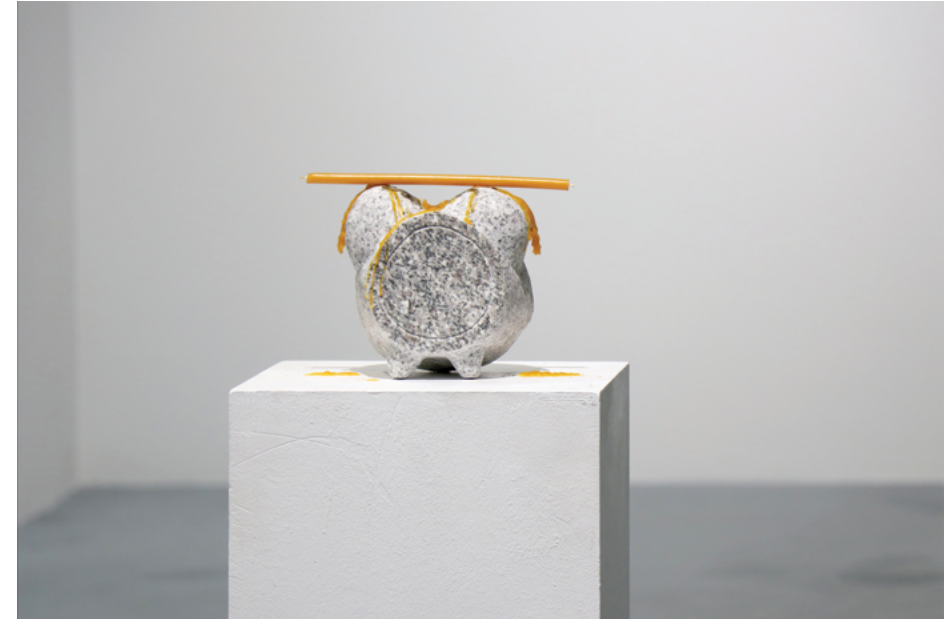
XII KONSTANTINOS PATELIS MILIĆEVIĆ (Iraklion, Krit, Grčka, 1997) Vreme , granit i vosak, 17×11×20 cm, 2021.

Za Ajnštajna je vreme relativno, a za istočnjačku filozofiju ciklično. Mnogo toga je neizvesno, ali trošnost i kraj svega što postoji su neizbežni, pa makar svaki kraj sa sobom nosio i neki novi početak koji održava kontinuitet i trajanje. I možda je baš to trajanje, kao i čežnja za njim, ono što našu stvarnost čini tako živom, dinamičnom i neuhvatljivom. Baš kao što je i vreme nedokučivo i neuhvatljivo, mada uporno otkucava.