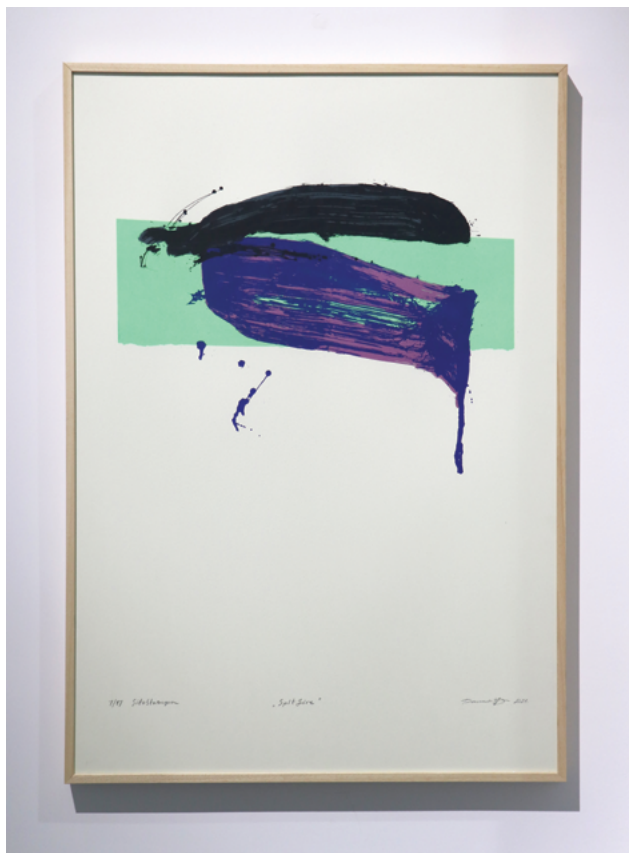
III DANILO PAUNOVIĆ (Niš, 1997) Spitfire , sitoštampa, 100×70 cm, 2021.

Glavna karakteristika mog rada jeste odbacivanje otvorenih političkih poruka, te želja za izražavanjem emocionalnih i duhovnih istina i potraga za univerzalnim ili moralno značajnim temama. Polazeći od filozofije i umetničke tradicije Dalekog istoka, moja dela teže prevazilaženju ego-logičke paradigme, postizanjem holističke perspektive u saznanju. Izveden bez bilo kakvog unapred određenog plana, crtež predstavlja spontani izraz misli i mentalnih slika. Zahvaljujući grafičkoj tehnici sitoštampe, element boje postavlja se kao suprotnost crnom ispisu četke i unosi živost, a svojim duhovnim sadržajem ove boje produbljuju simboliku crteža.