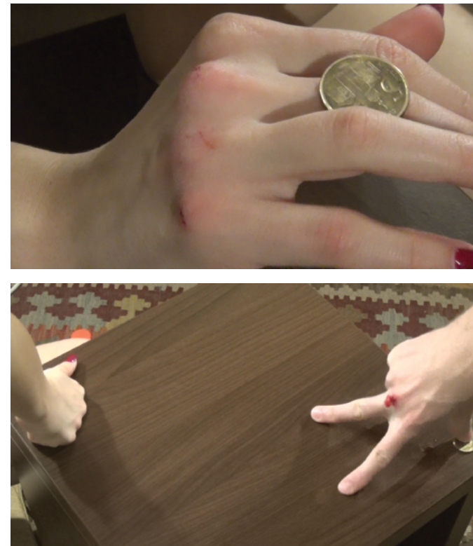
X SOFIJA PAŠALIĆ (Beograd, 1996)